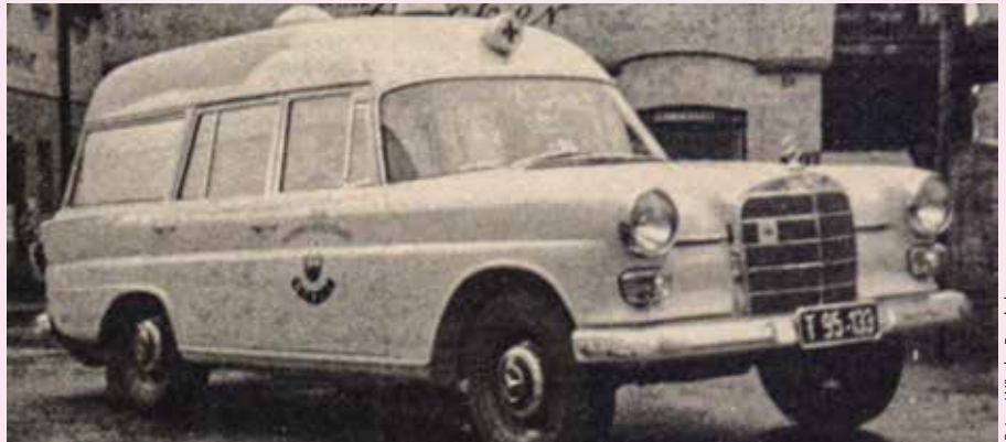
Der neue Rettungswagen

Stadtchronist Mike Pfeffer - Kontakt: chronist.woergl@snw.at